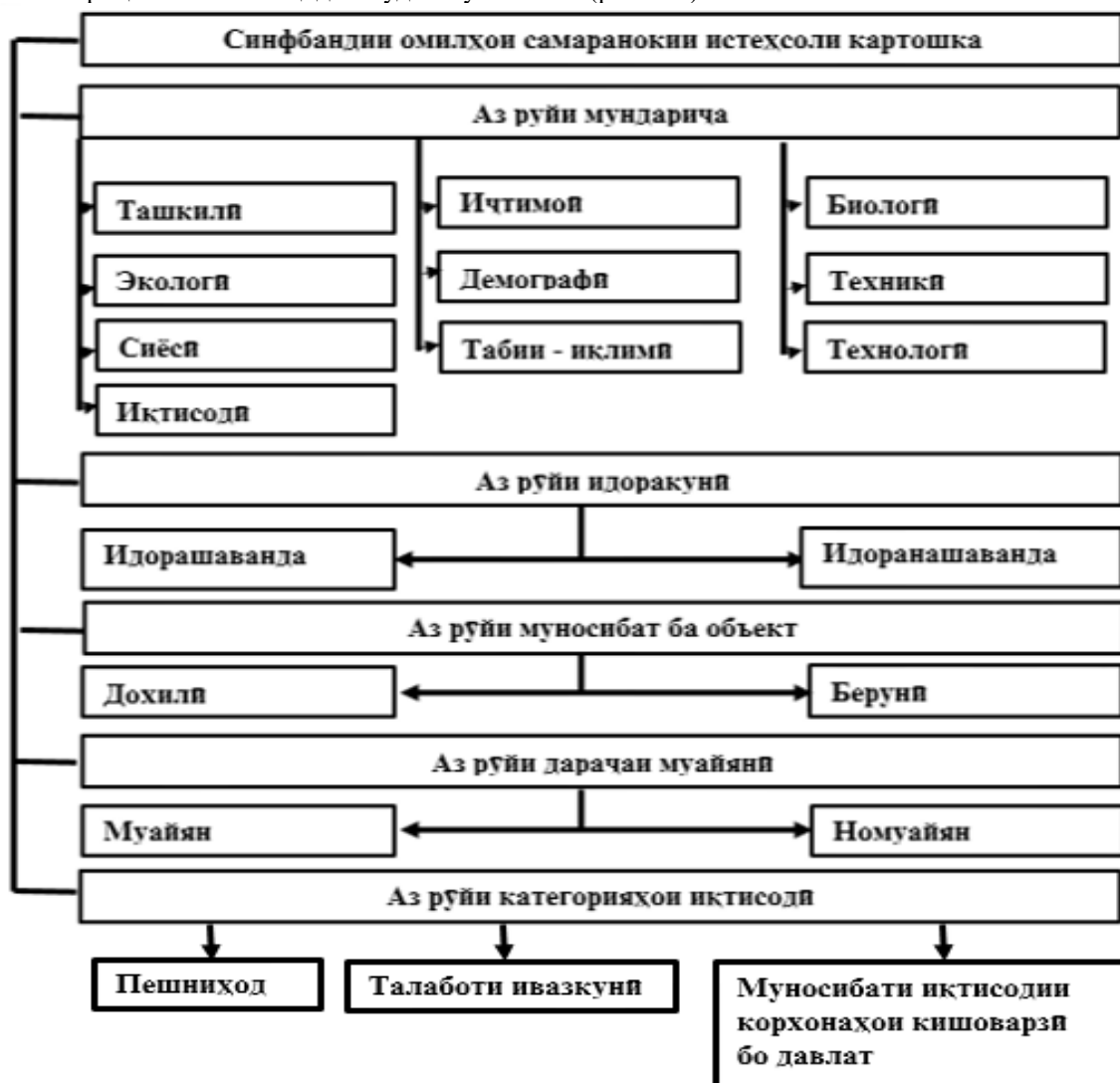
Расми 2.- Синфбандии омилҳои самаранокии истеҳсоли картошка вобаста ба аломат

Дар замони имрӯза муносибатҳоро оид ба гуруҳбандии омилҳо дар вобастагӣ бо аломатҳо, ки самаранокии истеҳсоли картошкаро ташкил медиҳанд, ба инобат гирифта, тасвири графикаи омилҳои асосиро ба тариқи зайл пешниҳод намудан мумкин аст (расми 2).