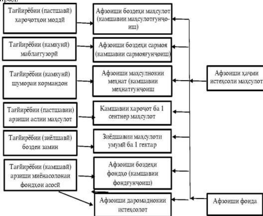
Расми 2 - Алоқамандии нишондиҳандаҳои самаранокии истеҳсолот

Ин формула, тибқи ақидаи муаллиф, на танҳо таносуби нархҳоро ба инобат мегирад, балки чараёни инкишофи таваррумро тавассути истифодабарии нишондиҳандаҳои маблағгузори сармояи асосӣ ва арзиши аслии истеҳсолиро низ ба назар мегирад.