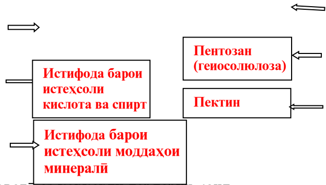
Расми 2. Маҳсулоти асосӣ ва иловагӣ аз коркарди лаблабуи қанд