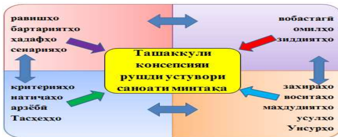
Расми 1. - Модели ташаккул ва татбиқи сиёсати саноатии минтақавӣ.

Бо назардошти нишондиҳандаҳои таҳқиқӣ, омилҳои муассирро дар ташаккули сиёсати минтақавии саноатӣ чунин гурӯҳбандӣ намудан мумкин аст: