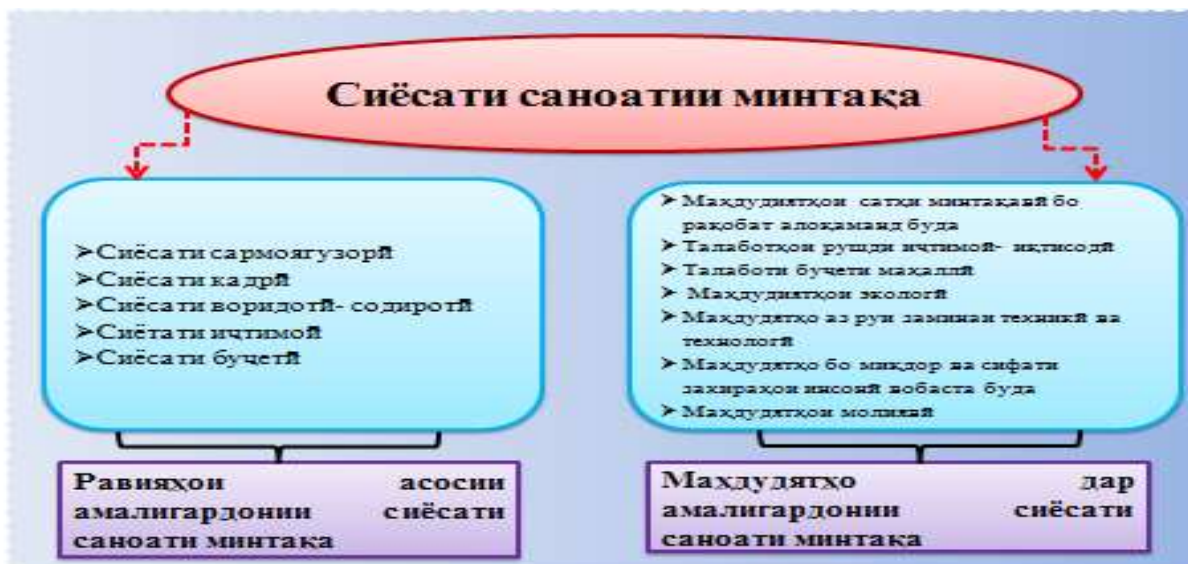
Расми 3. – Муқаррароти самтҳои таъминот ва маҳдудиятҳо барои татбиқи сиёсати саноатии минтақавӣ.